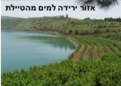
אזור ירידה למים מהטיילת