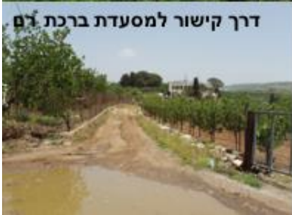
דרך קישור למסעדת ברכת רם