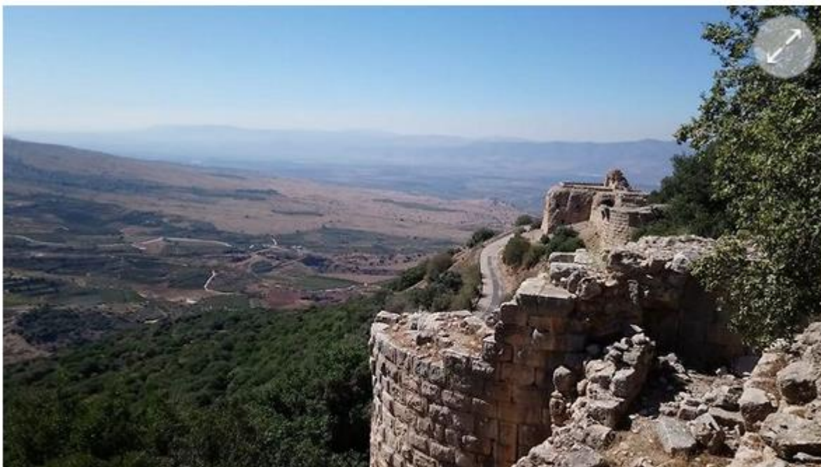
מבצר נמרוד