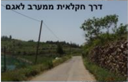
דרך חקלאית ממערב לאגם